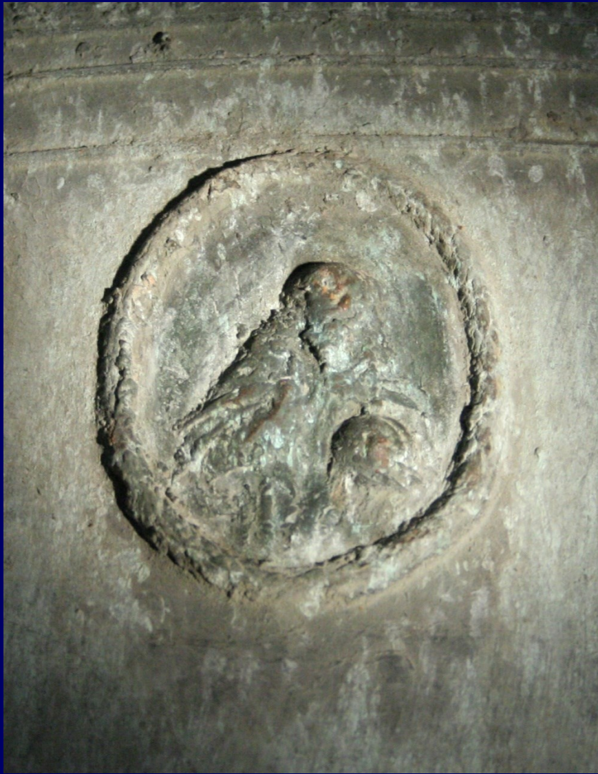
Dieu le Père tenant un globe