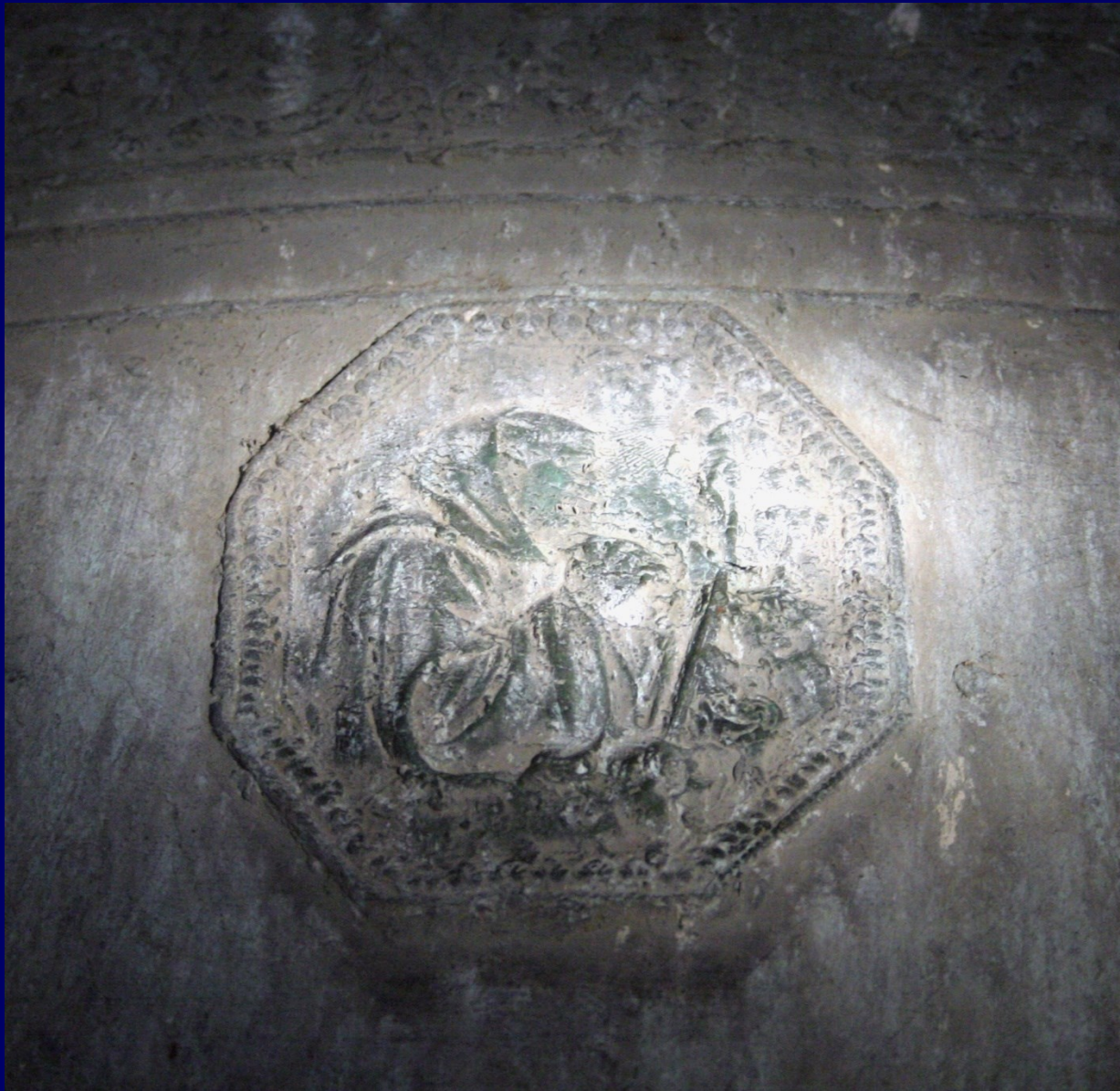
Moine en prière