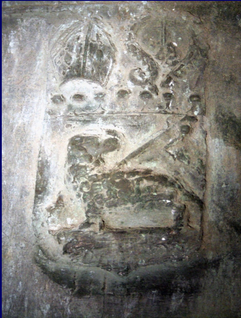
Armes de l'abbaye de la Trinité