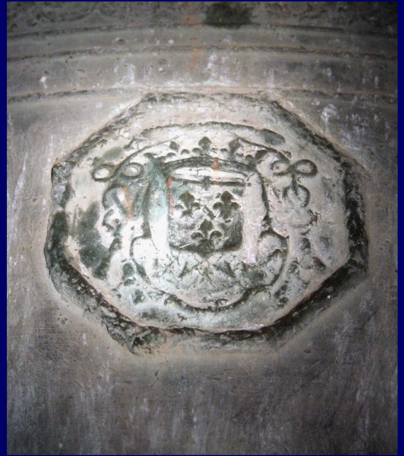
Armes de Philippe de Vendôme Écu des Bourbon-Vendôme, surmonté d'un chapeau de cardinal, couronne ducale, collier de l'ordre de Malte.