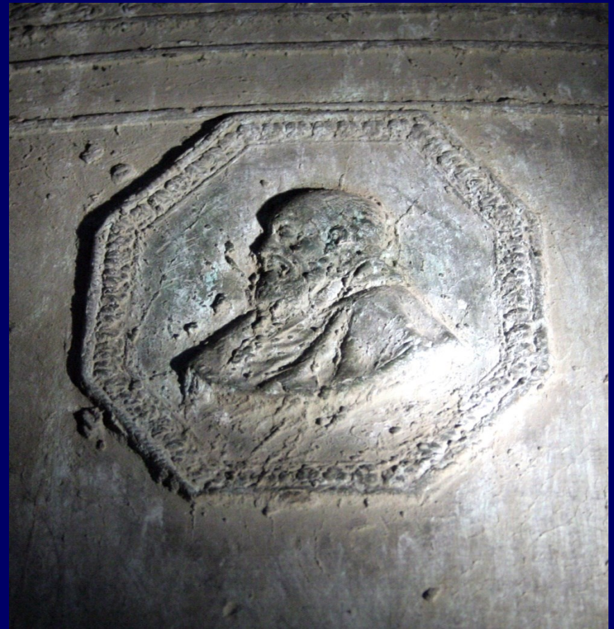
Un ecclésiastique (Antoine de Crevant †1539 ?)