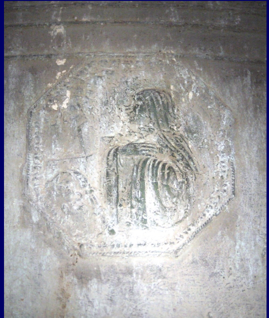
Abbesse en prière devant une statue de la Vierge