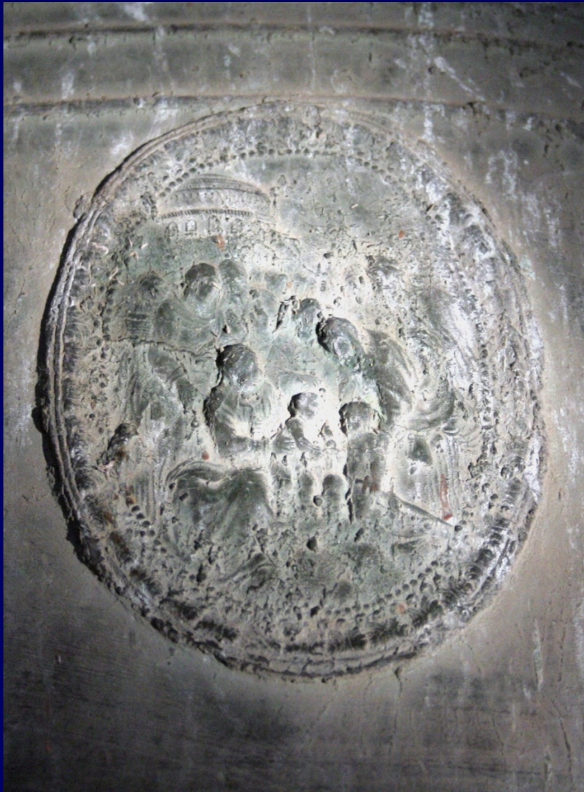
Adoration des Mages